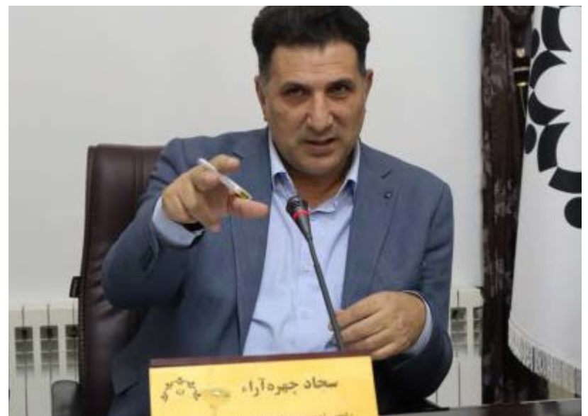
طی جلسه هم اندیشی مطالعات طرح جامع پدافند غیر عامل شهر خوی؛